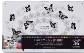
副賞の三菱鉛筆色鉛筆 No.888<36色セット>